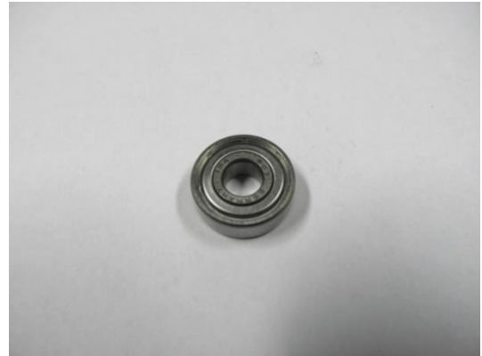
TA003544 ROULEMENT À BILLE 7 X 19 X 6