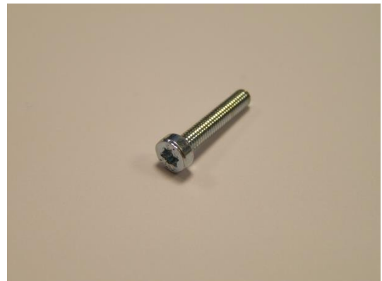
TA013499 VIS AESCULAP TORX SN4850 M3X16 TX 8.8 VZ