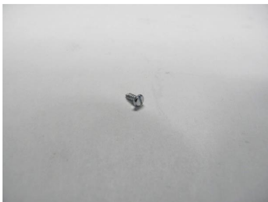
TA004627 VIS AESFULAP Z POUR PLAQUE B2,2X 6,5