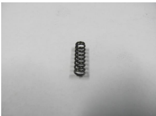
GT104217 RESSORT DE PRESSION