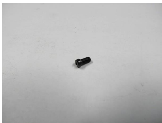
TA004639 VIS TÊTE PLATE AESFULAP DIN 85 M3,0 X6,0