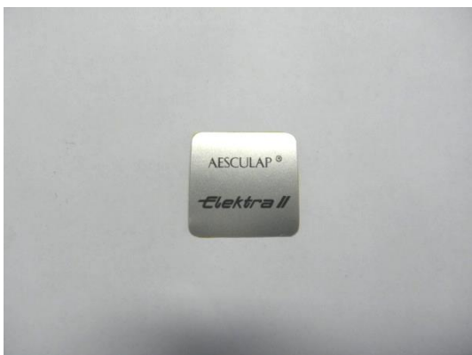
GH204337 ETIQUETTE AESCULAP ELEKTRA II