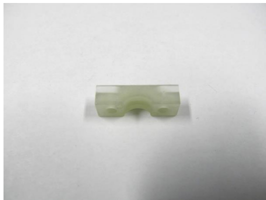
GT104213 SUPPORT SERRAGE CÂBLE