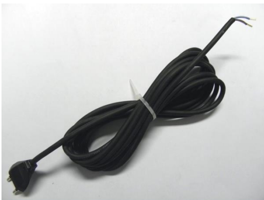
TA013520 CÂBLE D'ALIMENTATION AESCULAP 5M PRISE EUROPÉENNE