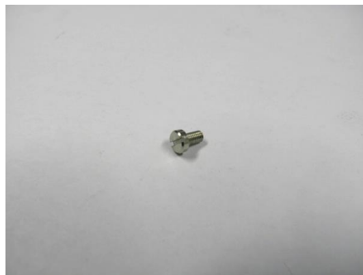
TA004663 VIS CYLINDRIQUE AESFULAP M3,0X5,5 DIN EN ISO 12