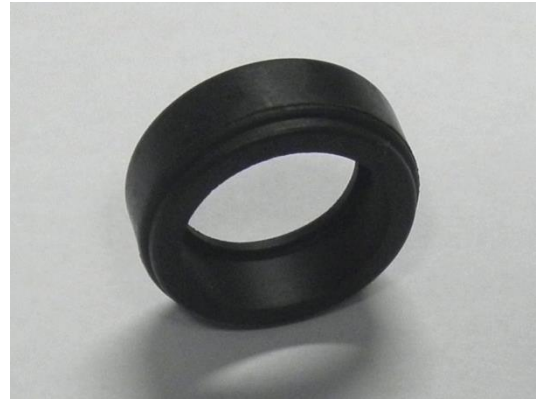
GT104320 SUPPORT CAOUTCHOUC POUR ROULEMENT