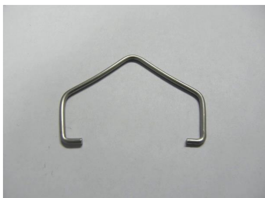
GT104227 ETRIER DE SUSPENSION