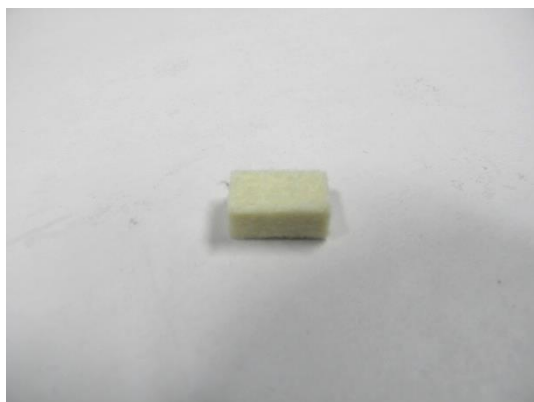
GT300224 FEUTRE HUILÉ 12x9