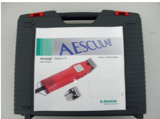
GT105819 BOITE AESCULAP FAVORITA JAZZ 5 011