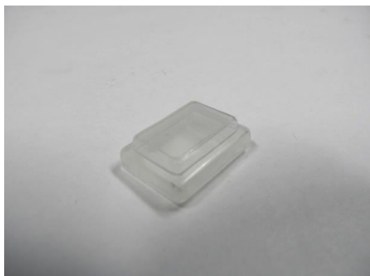
GT104249 CACHE INTERRUPTEUR