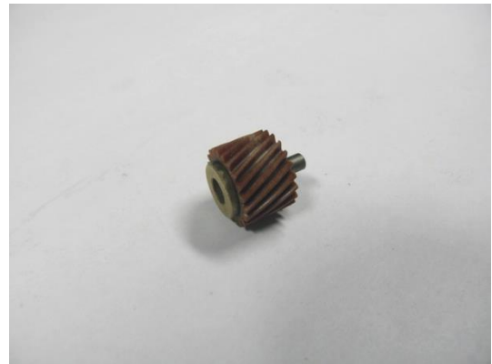
GT104840 ROUE CRANTÉE