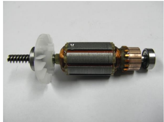
GT104865 MOTEUR EMBALLÉ