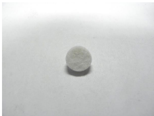
GT104225 DISQUE DE FEUTRE