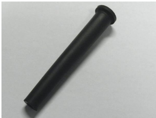
GT105326 MANCHON DE PROTECTION CÂBLE