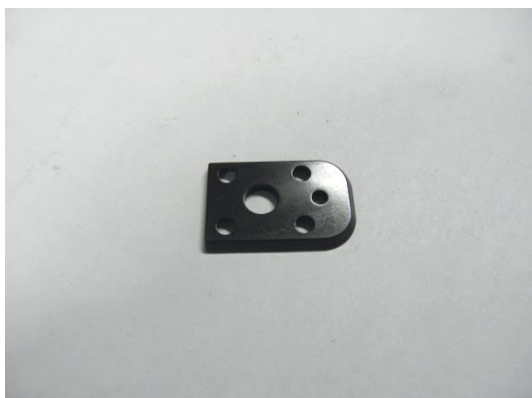
GT104415 QUEUE D'ARRONDE