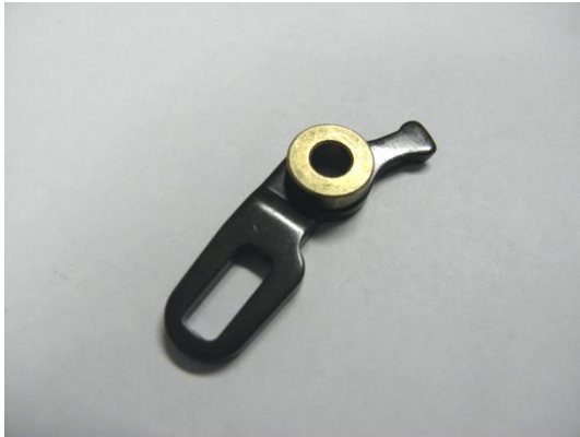
GT104808 OSCILLATEUR MONTÉ