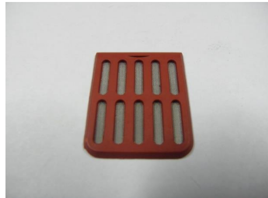
GT104803 FILTRE AESFULAP