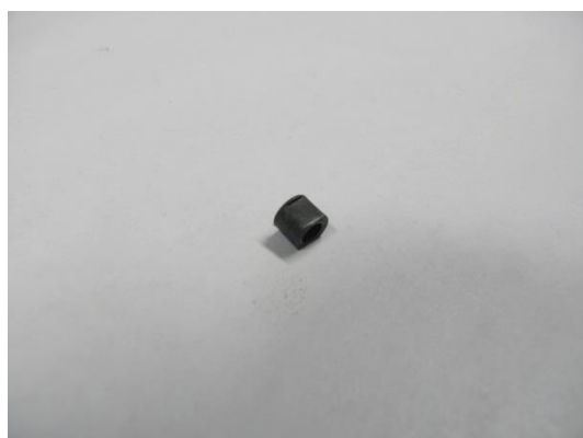
GT104244 BAGUE COULISSANTE