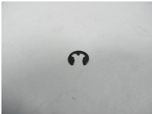
TA003820 CLIP DE MAINTIEN DIN799 5