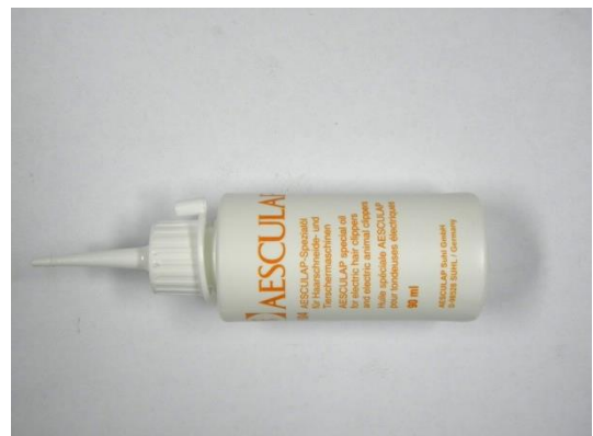
GT604 HUILE POUR TONDEUSE AESCULAP 90 ML