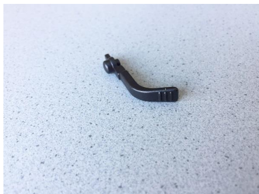
GT104316 LEVIER COMPLET