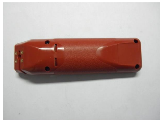
GT104801 COQUE AESFULAP INFÉRIEURE