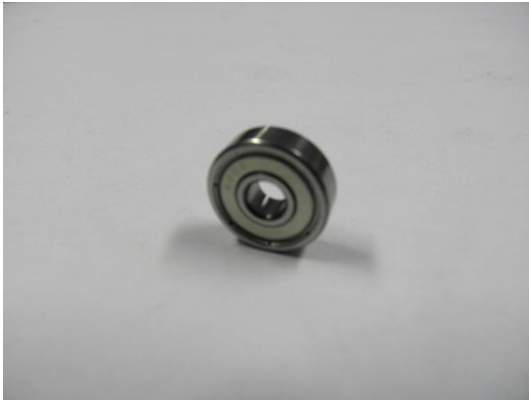
TA004631 ROULEMENT À BILLE 5 X 16 X 5