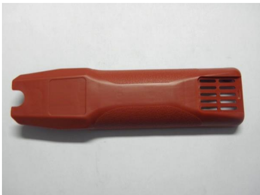
GT104802 COQUE AESFULAP SUPÉRIEURE