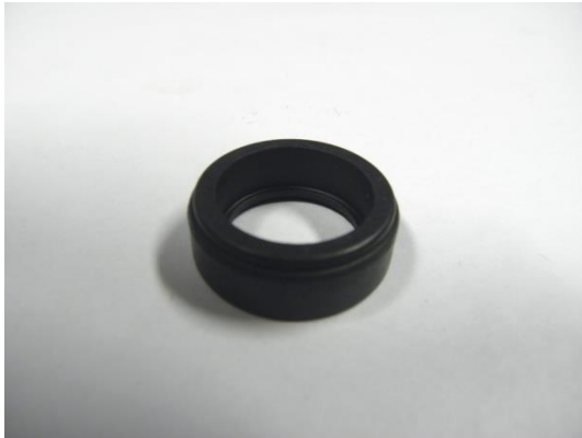
GT104319 SUPPORT CAOUTCHOUC POUR ROULEMENT